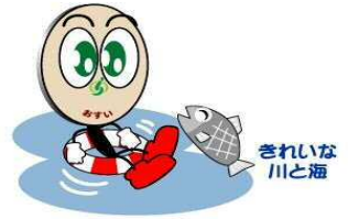
さいたま市下水道部マスコットキャラクター