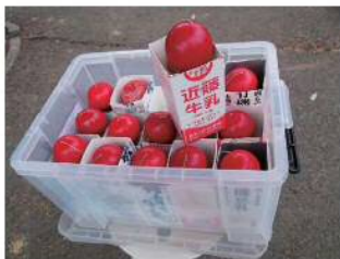
けん玉の収納箱は、牛乳パックのリメイク品。身近なもので作る技はさすがです。