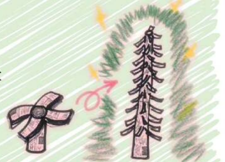
工作コーナーでは新聞がクリスマスツリーに！！

放課後の北浦和小学校の校庭に行くと・・・ 指導員さんが遊びに来た小学生にまず検温＆消毒の声掛け。 受付を済ませた子どもたちは紙芝居や工作など、自分で好きな遊びを好きなだけ楽しめます。 遊びに来た子どもたちが男性指導員さんを「おっちゃん！」と呼ぶ姿に、「地域で子育てしてもらえると、幸せだな～」と、うらやましくなりました。