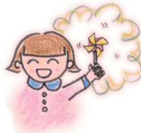
ストローとつまようじなどで作る風車。みんな走り回っちゃいます。