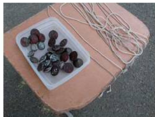
ベーゴマの大きさも大小そろえてあります。