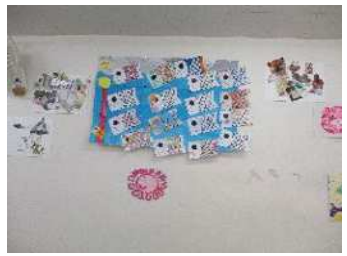
↑季節の貼り絵(こいのぼり)