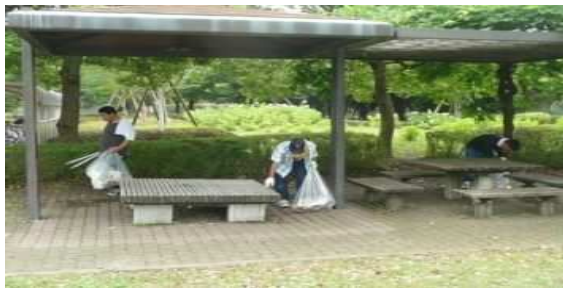
委託された公園清掃

施設内の内職作業だけでなく、リサイクル会社へ行っての開梱作業や委託された公園清掃作業など積極的に施設の外へ出て仕事をする取り組みを行っています。