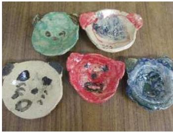
↑利用者さんと作った陶芸。施設にて素焼き、本焼きをしています。

生活介護では、軽作業のほか、季節の創作や療法士を呼んだアート療法や音楽療法、講師を呼んだ陶芸など多くの活動があります。また、日々健やかに生活するため、体操や公園でのウォーキングなど体を動かす運動プログラムも多くあります。