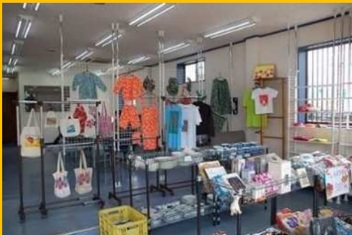
～Tシャツやエコバッグの印刷もしています～