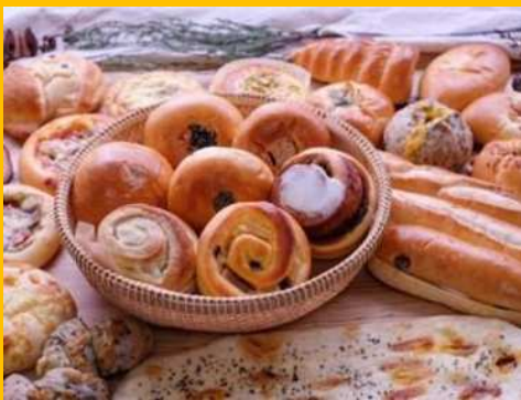
～あかしの森のパン～