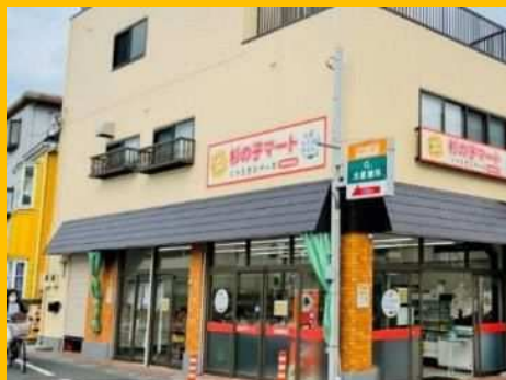
～コンビニエンスストア～