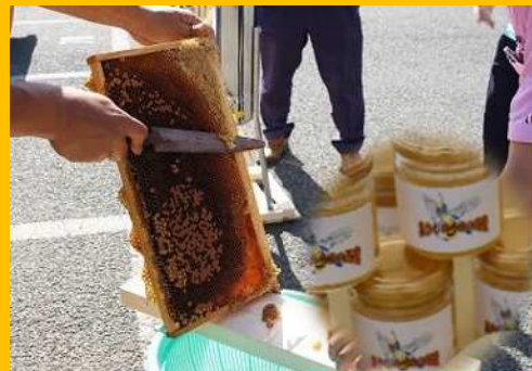
～蜂蜜も食べてみてください～