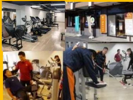
～フィットネスクラブの清掃中～