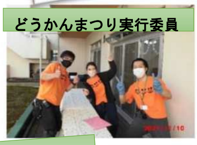
どうかんまつり実行委員