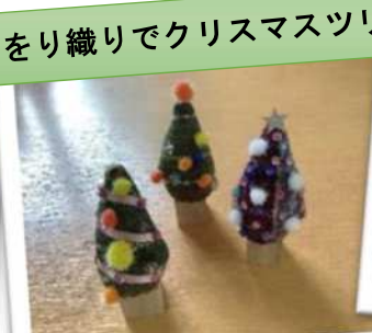
さをり織りでクリスマスツリー