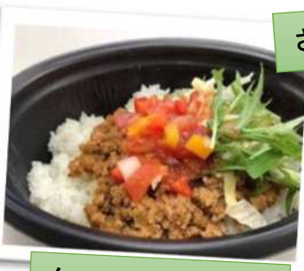
タコライス販売中