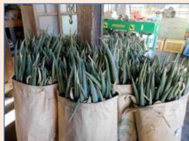
畑から収穫されたネギがたくさん！！