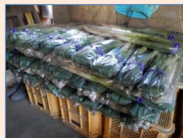
お客様のもとへ出荷します！！