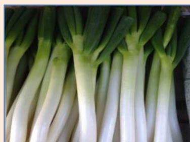
サイズ別に仕分けします！！太さがいろいろあります！