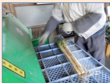
袋につめます！！冬場は泥付きネギが人気！