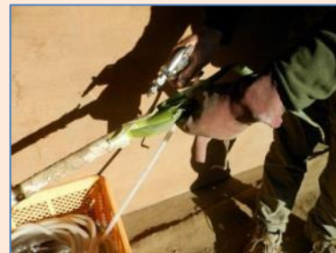
エアーで余分な皮をむきます！！