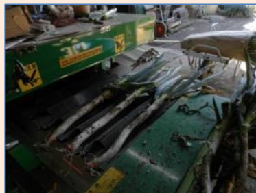
根葉切り機で根っこと葉を切っていきます！！センサーに合わせるのがコツ！