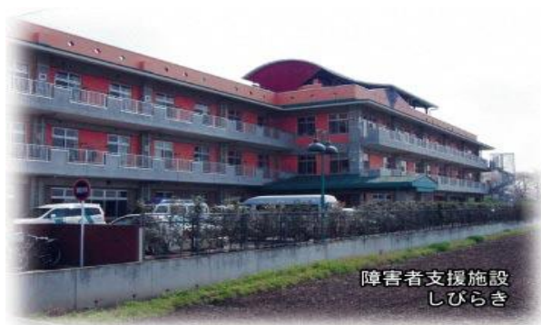
障害者支援施設 しびらき