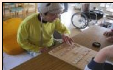
趣味の将棋を活かして職員と対決中です。