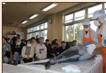
行事名：マグロの解体ショー 時期：1月 場所：しびらき 内容：大きなマグロを解体。皆さんで頂きます。