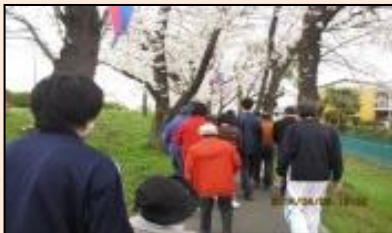
桜並木の下をお花見がてら散歩しています。