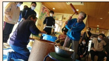
行事名：餅つき 時期：12月 場所：しびらき 内容：正月準備を皆で行って、 新年を迎えます。