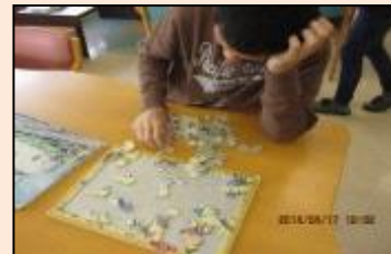
パズルに取り組んで頭の体操です。