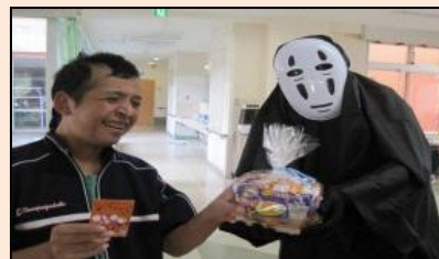
行事名：ハロウィン 時期：10月 場所：しびらき 内容：仮装パーティーを行います。