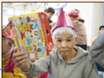
行事名：クリスマス・忘年会 時期：12月 場所：しびらき 内容：歌や音楽で年末に盛り上がります。