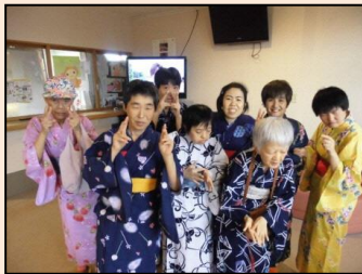
行事名：納涼祭 時期：8月頃 場所：しびらき 内容：家族の方と夏祭りを楽しみます。