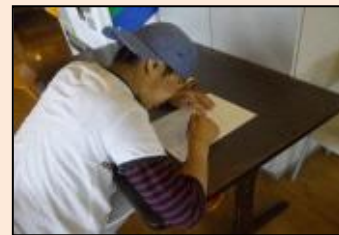
得意な計算問題への取り組み。毎日のルーティーンです。