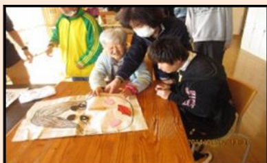
行事名：新年会 時期：1月頃 場所：しびらき 内容：書初めをして一年の目標 を立てます。