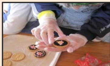
行事名：バレンタイン 時期：2月 場所：しびらき 内容：調理実習でバレンタインのお菓子作り。