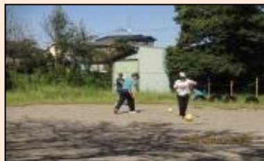
近くの公園に行ってボールを使った運動。体力作りの一環です。