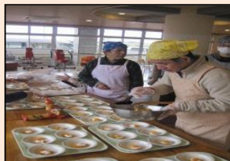
行事名：ホワイトデー 時期：3月 場所：しびらき 内容：バレンタインのお返し作りです。