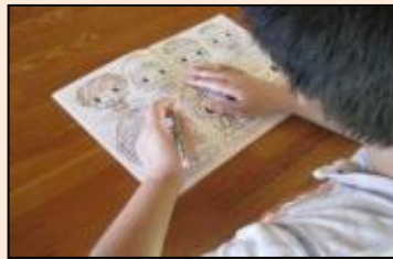
塗り絵に挑戦中。色使いの練習や集中力を養います。