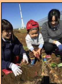
地域の子供と芋掘りの様子。