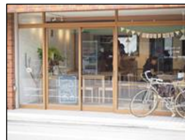
従たる事業所 ひとつつながるカフェ