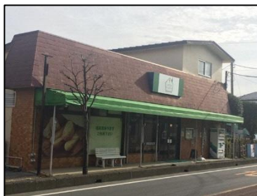
主たる事業所 しびらきベーカリー