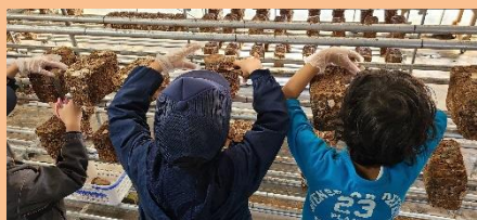
地域の子供たちがしいたけ狩りを体験。