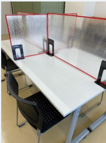
感染症対策の為、仕切りを使用