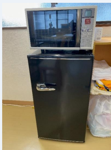
冷蔵庫、電子レンジ完備