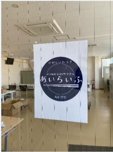
あいらいふのロゴ (入口玄関)