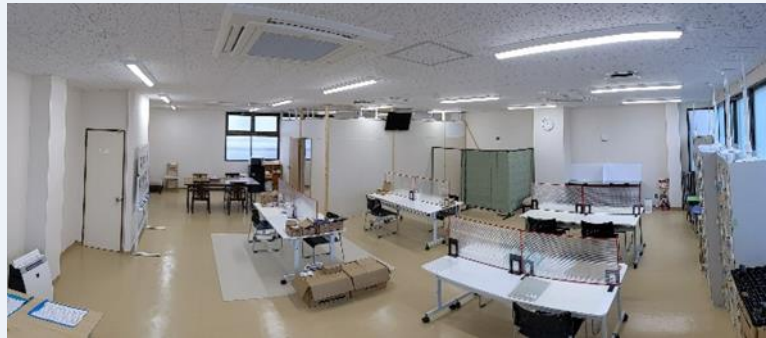
玄関から事業所内を見渡した様子