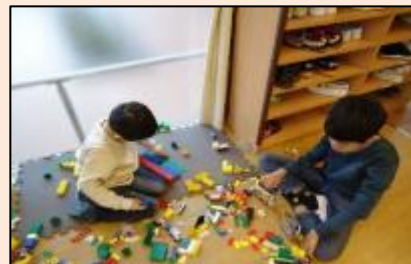
二人で力を合わせて何が できるのかな？