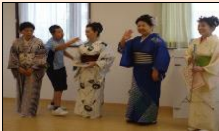
盆踊り みんな踊っていました