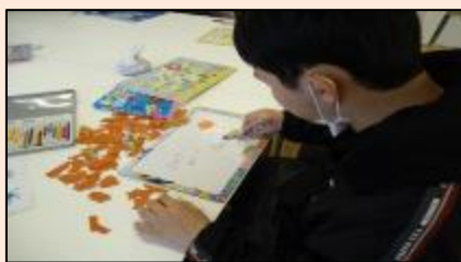
複雑なパズル作制 ガンバレー