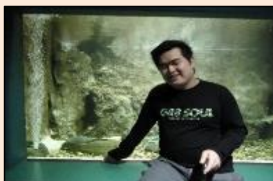
水族館に行ってきました。 た。