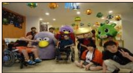
夏祭 着ぐるみ来所！！