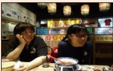
外食ツアー—普段食べられないものを食べよう