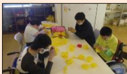
共同制作。何が出来上がる かな？