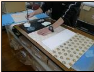
仏具カバー 台紙に貼る作業です。