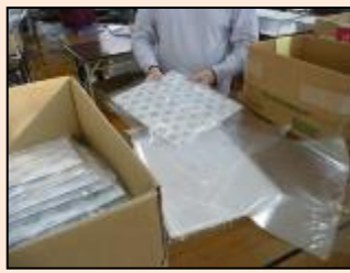
仏具カバー 完成した仏具カバーを袋詰めしています。