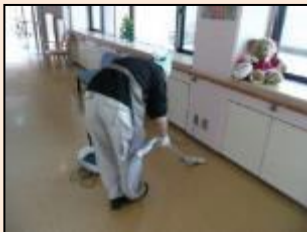
高齢者施設内清掃の受託 週に2回、近所の高齢者施設の館内清掃に行っています。(食堂、廊下、トイレ) ※現在は中止しています。