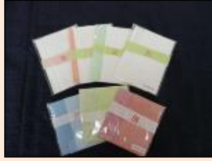
紙すき作業 すいた紙を製品に仕上げます。ポチ袋、しおり、封筒などに加工して、区民まつり等のイベントや岩槻区役所でのピアショップ、などで販売しています。

所外作業 令和4年1月から、週2回(火・木)近隣の会社に出向き野菜の袋詰め作業を行なっています。