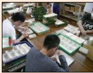
部品の数え作業 数種類の細かい部品を指示された数量(1~36個)に数えます。