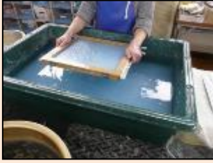
紙すき作業 牛乳パックのコーティングをはがすなどの処理をした後に、パルプにします。パルプをすいて紙にします。