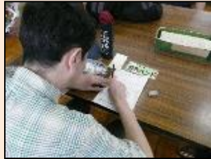
日誌の記入 その日行った作業や活動を記入し、帰宅します。