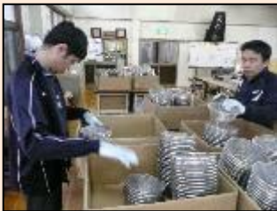
材料の検品作業 不良品がないか、一つずつ、丁寧に検品していきます。