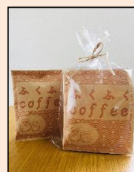
ドリップコーヒー制作

注文が入るとすぐ焙煎を たのみ、その焙煎したの 豆を良い香りに包まれな がらパッキング。ご自宅 で新鮮なスペシャルティ コーヒーの風味を楽しめる、 自慢のドリップパックを 作っています。