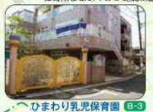
ひまわり乳児保育園 子育て支援センター