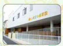
上木崎保育所 (愛称) ひだまり保育園 子育て支援センター