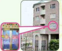
子育て支援センターうらわ イベントスタワー東館3F