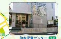
仲本児童センター