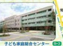
子ども家庭総合センター (あいばれっと)