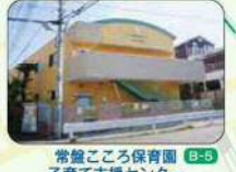
常盤こころ保育園 子育て支援センター