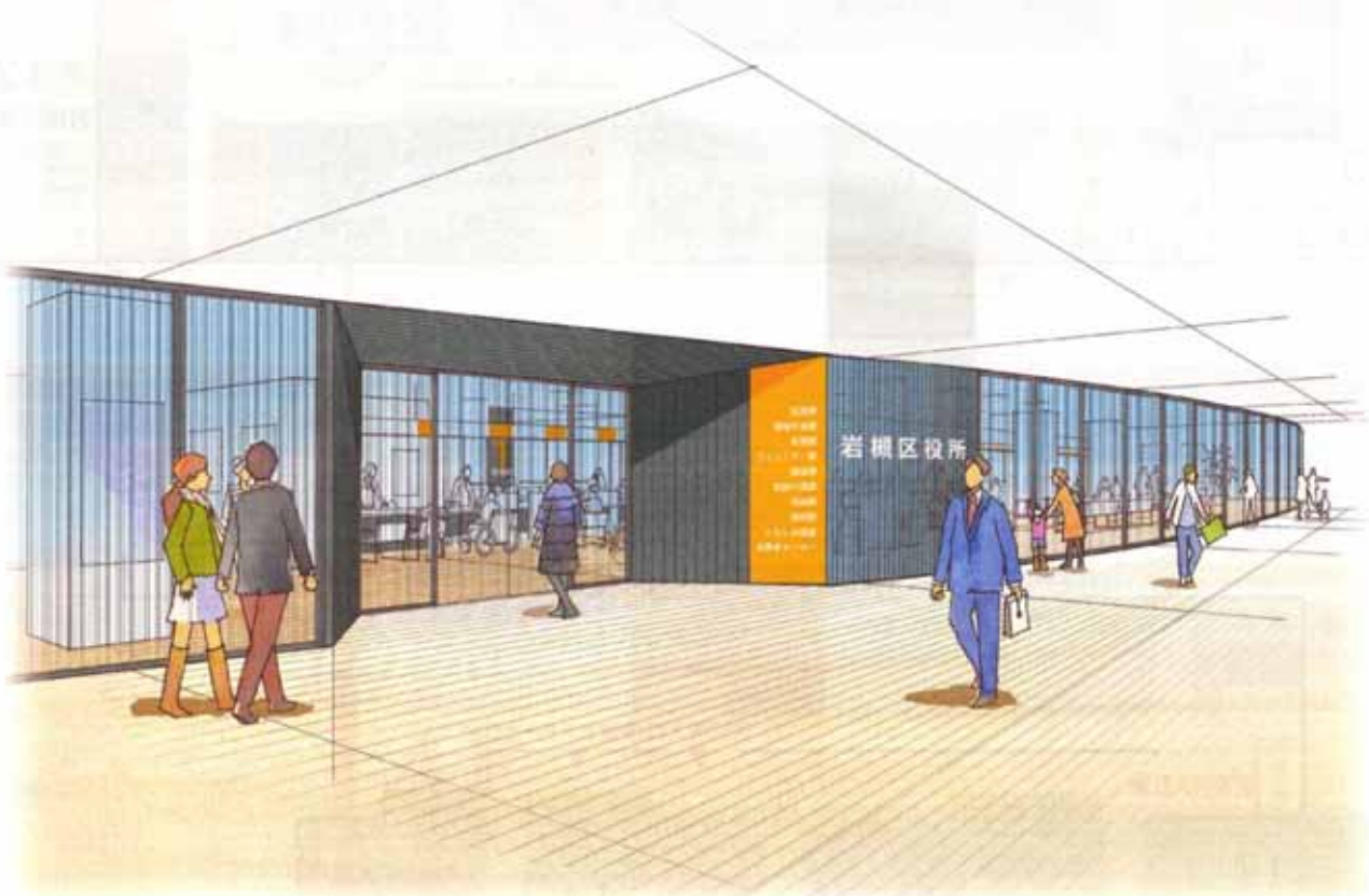
新庁舎イメージ図