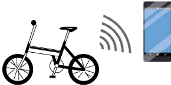
通信機能搭載の自転車