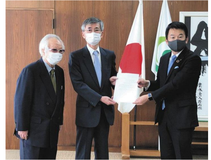
市民憲章（案）の答申の様子

資料公表場所：①各区役所情報公開コーナー ②図書館、公民館、コミュニティセンター ③市ホームページ など