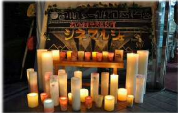
マーケットを中心とした地域活性化再生事業 (中央区役所 総務課)