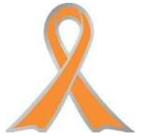
オレンジリボンマーク