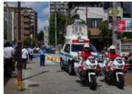
交通安全パレード（浦和区）