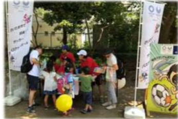
子どもボランティア隊の創設と運用 (スポーツ文化局 利用・普及・リハビリ課)