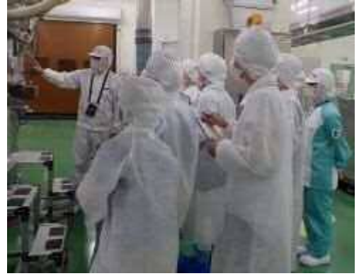
一日食品衛生監視員 工場内監視の様子

低年齢層を含めた消費者が食品衛生監視業務を体験できるイベント（10組20名程度）を実施し食の安全に関する知識の普及を図ります。