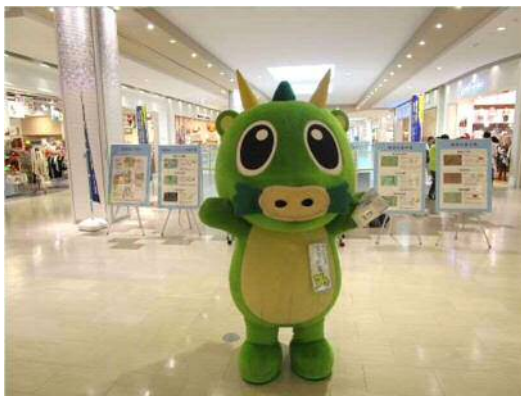
街頭キャンペーンの様子

ノロウイルスによる食中毒や感染症に対する正しい知識の習得と調理従事者による二次感染を未然に防止することを目的に、市内の福祉施設や学校等にノロウイルスに関するリーフレットの配布や研修会を開催するとともに、消費者への街頭キャンペーンを実施し、知識の普及啓発を図ります。