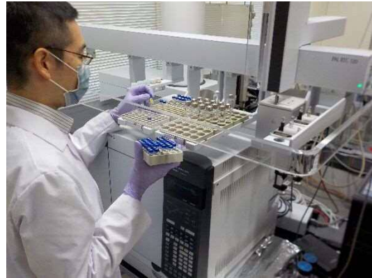
理化学検査の様子