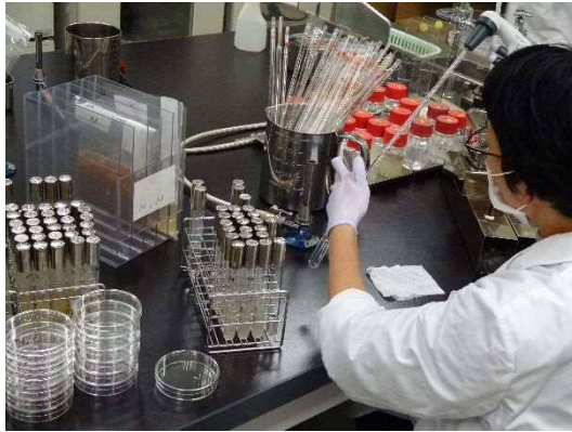
微生物検査の様子