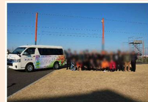
西区指扇地区乗合タクシーあじさい号 記念式典の様子