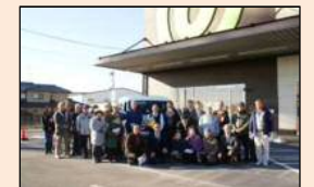
ビバホーム乗入時の式典の様子