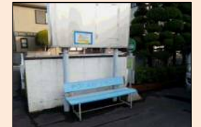
岩槻南病院に設置されたベンチ