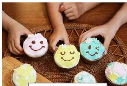
手づくりのお菓子