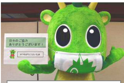
身近な方などへのメッセージ