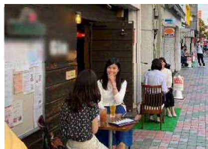
イメージ