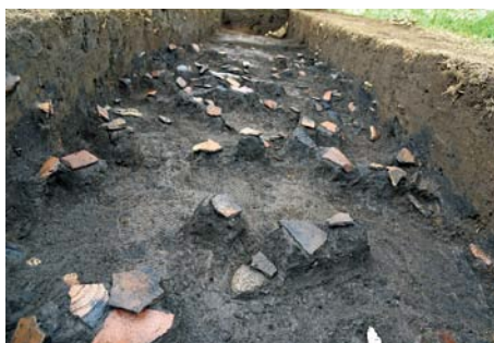
真福寺貝塚(岩槻区) 土器(縄文時代)の出土状況