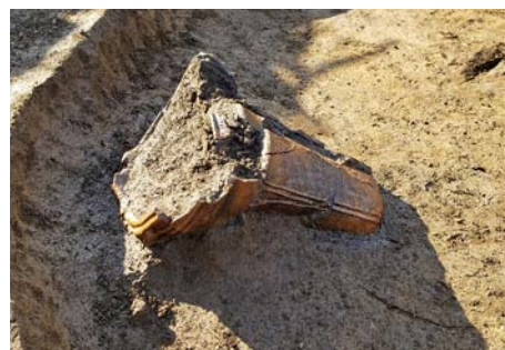
南中丸下高井遺跡(見沼区) 住居跡から出土した土器(縄文時代)