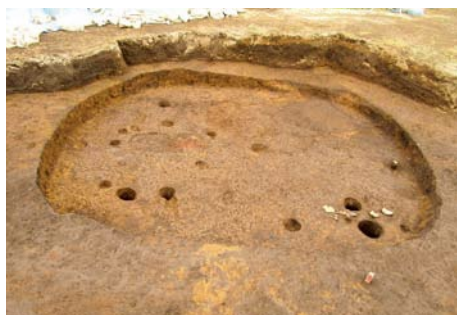
中野田中原遺跡(緑区) 住居跡(弥生時代)の様子

令和元年度には、市内の16の遺跡、19か所で発掘調査を行いました。今回の展示では、これらの調査で出土した遺物や、遺構の写真などを通じて、調査の成果を市民の皆様いち早くご紹介します。