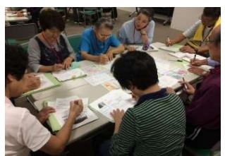
地域資源のグループワーク