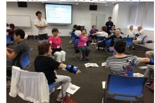
いきいき百歳体操実践中