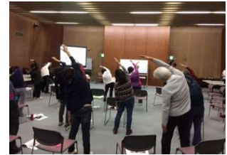
準備・整理体操実践中