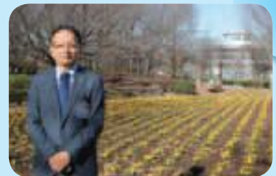
▲大宮花の丘農林公苑にて

西区役所で発行している地域情報誌「にしなび」では、花の見どころを紹介していますので、「にしなび」を片手に、区内を散策してみてもはいかがでしょうか。