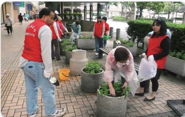
駅周辺の植栽活動

緑化意識の向上と、区民同士のふれあいや絆を深めるため、身近な場所で緑に出会う機会の創出や、区の緑化推進のシンボルフラワーである「区の花」のPRなどを行います。