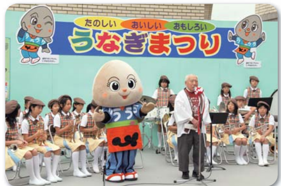
第9回 浦和うなぎまつり