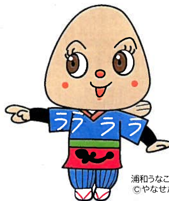
浦和うなこちゃん ©やなせたかし