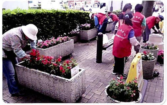
駅周辺の植栽活動